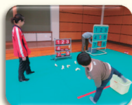
▲令和元年度の様子